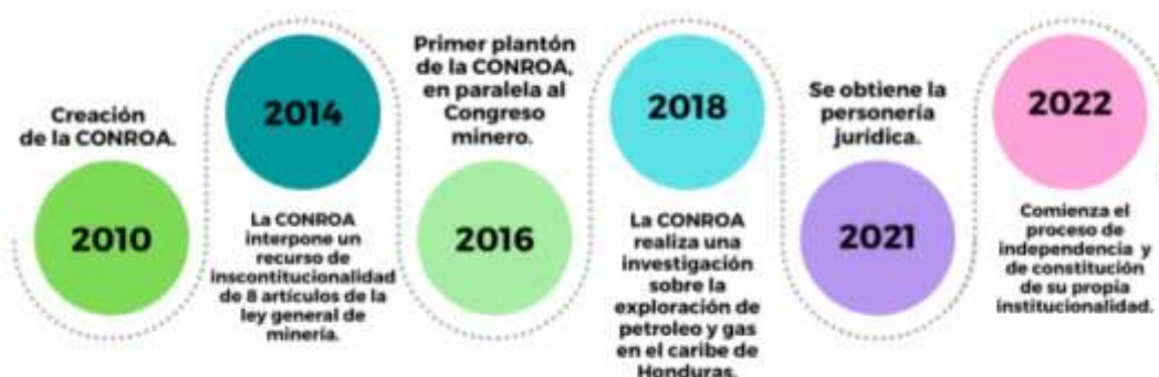
Figura 2 Línea del Tiempo

En la línea de tiempo se evidencian los hitos de mayor relevancia para el eje de articulación, partiendo del año 2010 al año 2022.