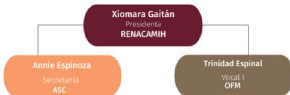
Figura 4 Órgano de Fiscalización