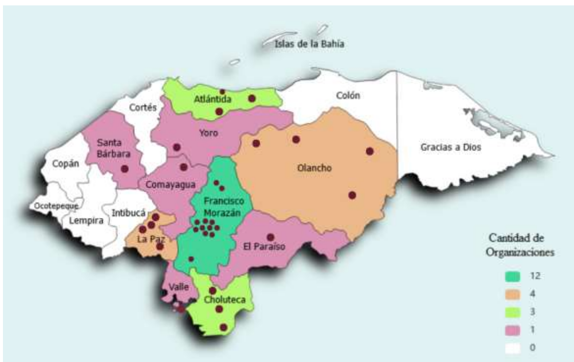
Figura 5 Mapas de Organizaciones Miembros

A continuación, se presentan en la figura 2 la ubicación de las organizaciones miembros a nivel Nacional.