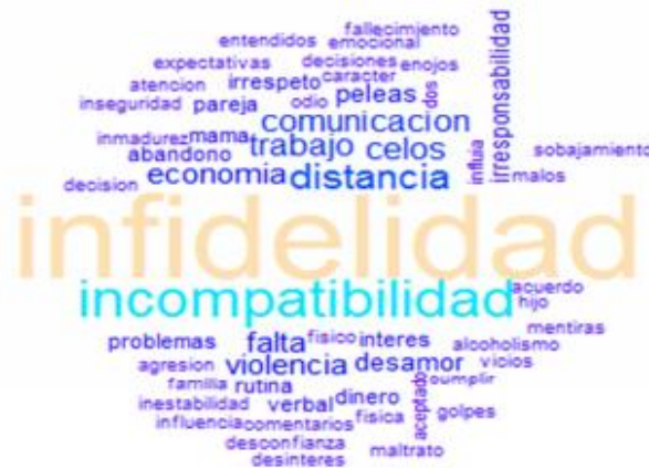
Figura 3. Respuesta sobre las causas de separación o divorcio, de acuerdo con el orden de relevancia. Fuente: Causas de separación y divorcio en Xalapa, México (Córdova y Oliva, 2018).

Los resultados de dicho estudio respaldan que la primera causa de separación o divorcio es la infidelidad por parte de uno de los cónyuges; evidenciado por la interacción de los encuestados a través de la técnica lluvia de ideas; tal como se representa en la Fig 3.